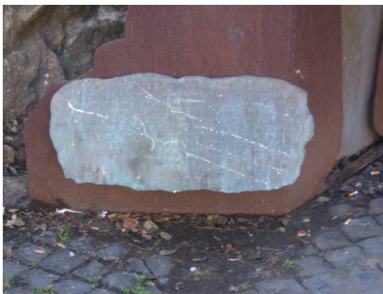
Figura 4: La targa oramai illeggibile

In buono stato sono ancora le fusioni in bronzo delle mani incatenate poste in corrispondenza di ogni sagoma, che hanno perfettamente resistito al passare degli anni.